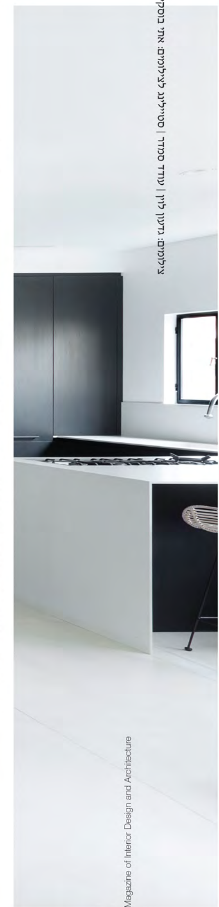
The Magazine of Interior Design and Architecture