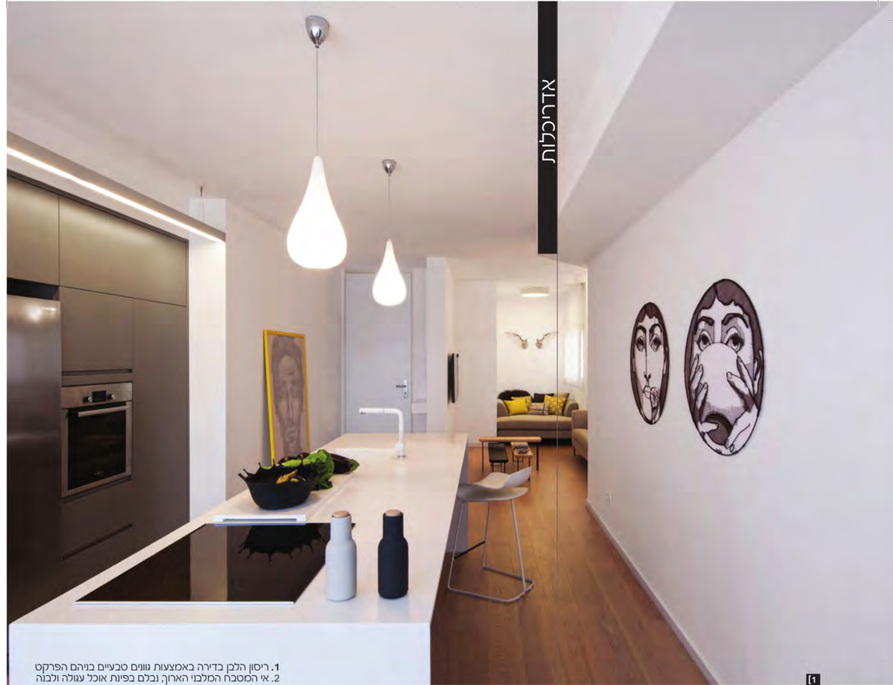
1. ריסון הלבן בדירה באמצעות גוונים טבעיים בויהם הפרקט 2. אי המטבח המלבני הארוך, נבלם בפיות אוכל עגולה ולבנה