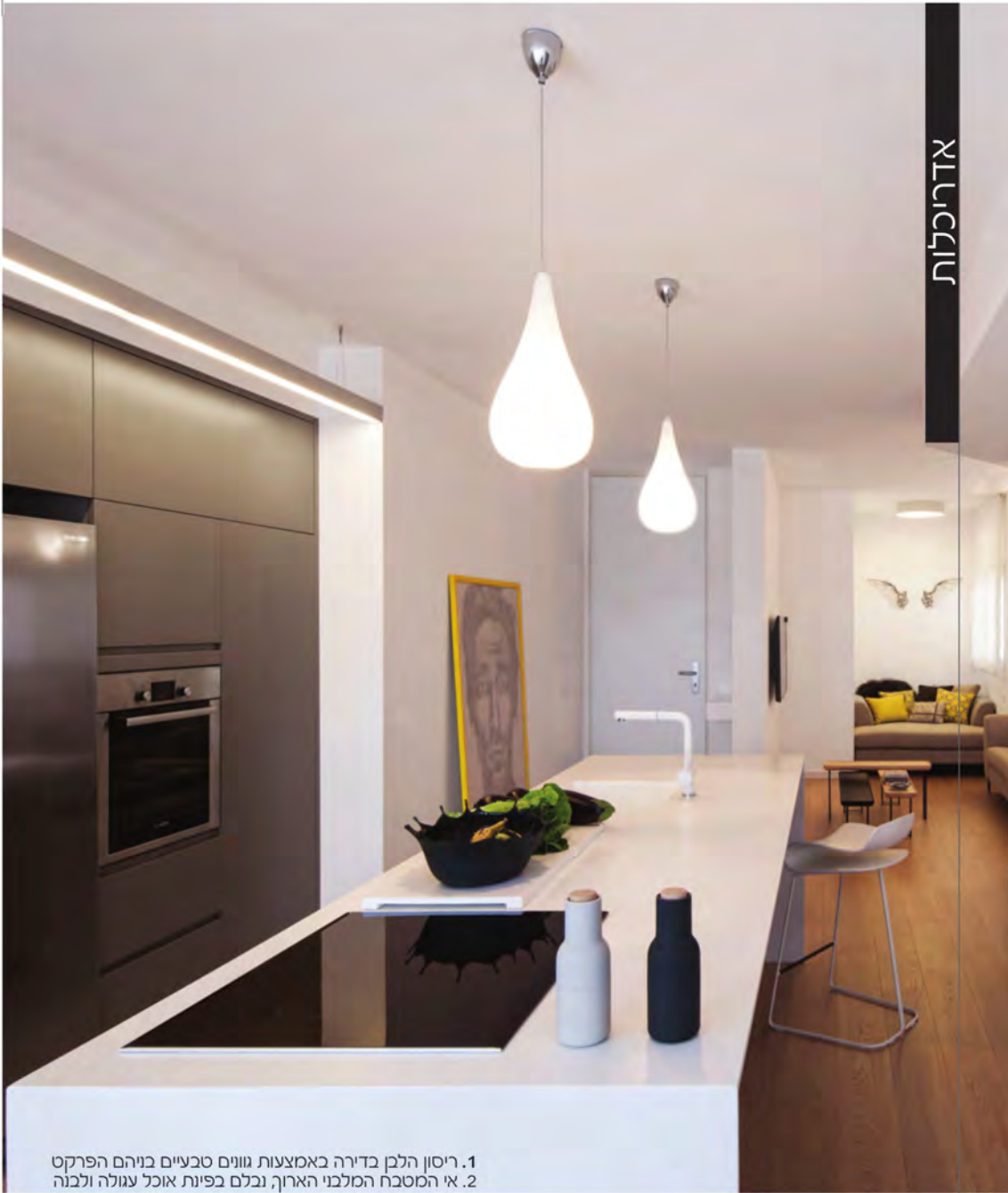
1. ריסון הלכן בדירה באמצעות גוונים טבעיים בויהם הפרקט 2. אי המטבח המלבני הארוך, נבלם בפיות אוכל עגולה ולבנה