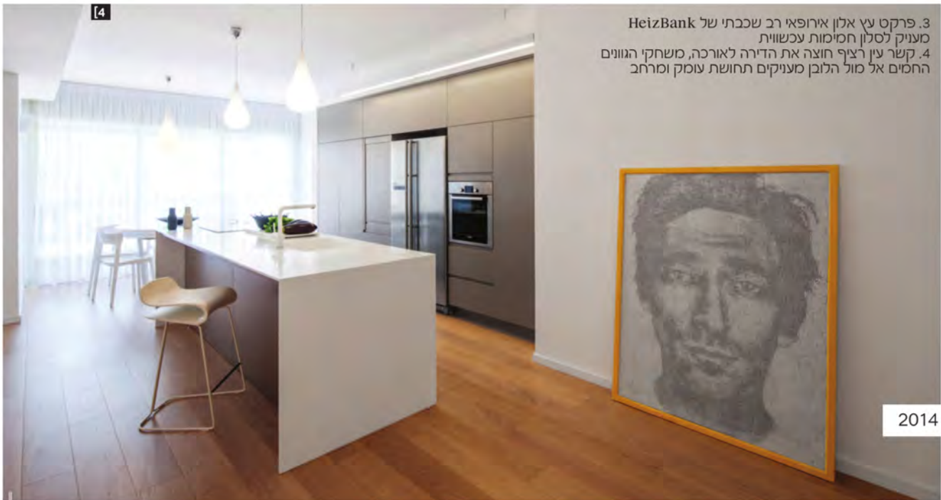
3. פרקט עץ אלון אירופאי רב שכבתי של HeizBank מעניק לסלון חמימות עכשווית 4. קשר עין רציף חוצה את הדירה לאורכה, משחקי הגוונים החמים אל מול הלבן מעניקים תחושת עומק ומרחב