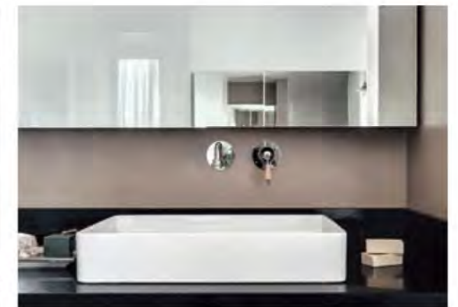
Apartment with terrace and view of the harbor on the Mediterranean Sea, in Ashdod, Israel. Design by Oshir Asaban, portrayed in the photo, previous page. These pages, the bedroom area equipped with master suite, cabinet and bathroom; previous pages, the living room characterized by a mix of natural materials and blue tones. Highly customized